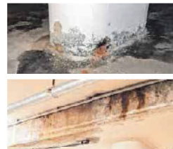
So sah es noch vor der Sanierung aus.

bei 2 Parkebenen. Ursprünglich waren Teile der Tiefgarage für den nuklearen Katastrophenfall als Schutzraum für die Bevölkerung gebaut worden und nicht für die Nutzung als Tiefgarage. „Sämtliche Bauteile, die im Kontakt mit tausalzhaltigem Wasser standen, besaßen keinen Schutz“, erklärt der leitende Ingenieur Frank Muhsau. Außerdem erwies sich der Rückbau der Einbauten für den Katastrophenschutz als sehr aufwändig. Die gesamte Tiefgarage ist offen und hell gestaltet inklusive einer neuen Beleuchtung. „Alles in allem ein rundum gelungenes Projekt“, so Landrat Elmar Stegmann.